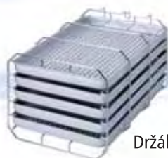
Držák „A“ Pro šest táců

Autoklávy se vždy dodávají s držákem táců nebo kazet. Je zahrnut v ceně. Sériově se dodává držák kombi „C“ (pro šest táců nebo tři normalizované kazety). Prosím, udejte při objednávce vždy, přejete-li si místo držáku „C“ bezplatně držák „B“ pro čtyři normalizované kazety nebo držák „D“ pro dvě vysoké kazety, například pro kazety na implantáty nebo pro vyšší sterilizační kontejnery či kontejnerové sestavy.