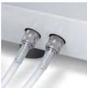
Připojení přes rychlospojky

Veliký otvor zásobníku vody ve spojení s vestavěným pomocným zařízením pro plnění rezervoáru umožňuje u přístrojů Vacuklav® 31 B+ a Vacuklav® 23 B+ snadné plnění demineralizovanou nebo destilovanou vodou. Alternativně mohou oba autoklávy nasávat potřebnou vodu z libovolného externího zásobníku, nebo mohou být dokonce spojeny se zařízením na úpravu vody.