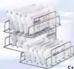
Stojan na balené nástroje