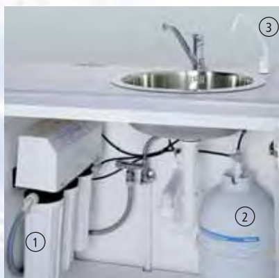
MELAdem® 47 (1) instalovaný ve spodní skříně se zásobníkem (2) a kohoutkem na odběr (3).