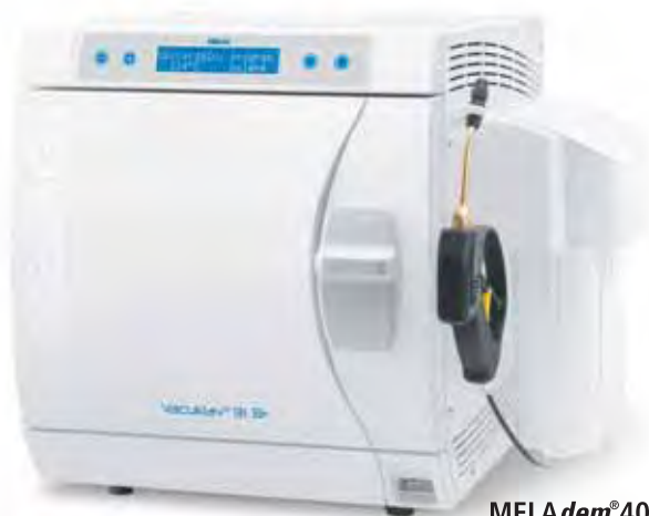
MELAdem®40 namontovaný na Vacuklav® 31 B+

Obsluha autoklávů má působit radost a má být bezpečná. Design tyto nároky podporuje. Ukazuje to podstatně a při tom efektivně. Nejenom že velký dveřní mechanismus přístroje dobře vypadá, ale zajišťuje též snadné otevírání a zavírání přístroje.