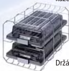
Držák „D“ Pro dvě vysoké kazety (např. pro tácy na implantáty)