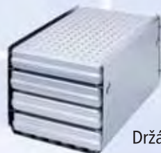
Držák „B“ Pro čtyři normalizované kazety (nebo pro čtyři tácy)