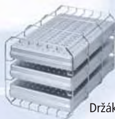
Držák „A“ (otočený) Pro tři normalizované kazety